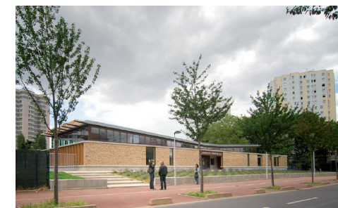
Maison de quartier du Chemin de l'Île 61/63, boulevard du Général Leclerc. 92000 Nanterre